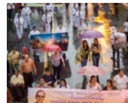
Rückseite: Am Vorabend der Seligsprechung, 2015