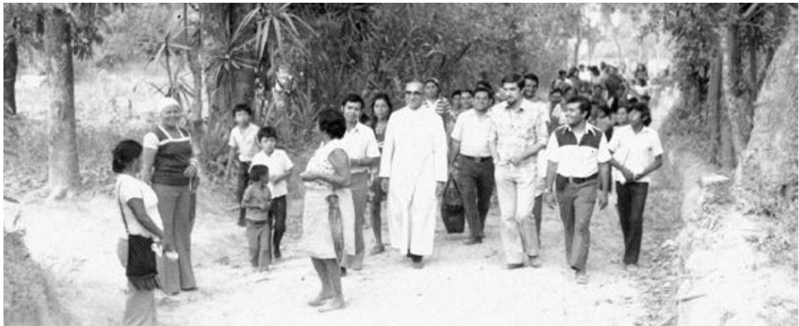
Oscar Romero (Mitte) setzte sich für eine Landreform und würdige Arbeitsbedingungen ein.

Um Mons. Oscar Romeros erzbischöfliches Wirken und Martyrium verstehen zu können, ist es wichtig, den geschichtlichen Kontext zu kennen. In seinem Amt, zunächst als Bischof von Santiago de María und später als Erzbischof von San Salvador, durchlief Mons. Romero eine Entwicklung als Reaktion auf diese Gegebenheiten. Seine Geradlinigkeit angesichts eines armen und unterdrückten Volkes war entscheidend für die Ausübung seines Bischofsamtes und seinen Tod als Märtyrer.