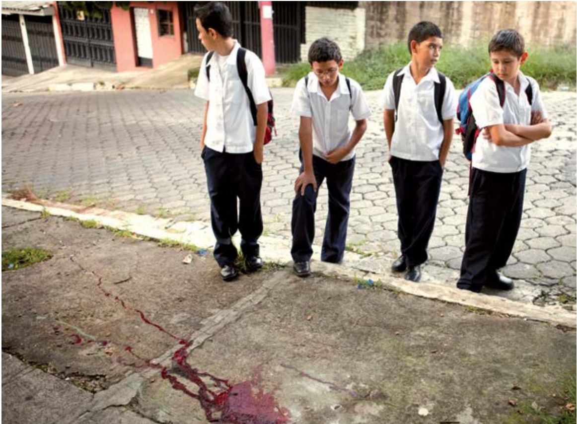
Alltag in San Salvador: An dieser Stelle wurde ein Schüler aus dem Stadtteil Soyapango erschossen.

Ich nenne diesen jungen Mann Óscar. Er kommt aus einem der Armenviertel, in denen es unendlich viele pandilleros (Bandenmitglieder) gibt: alte und neue pandilleros, ebenso Familien von pandilleros und Kinder, die Banden angehören. Bandenmitglieder über Bandenmitglieder, die das Gesicht der Armut tragen.